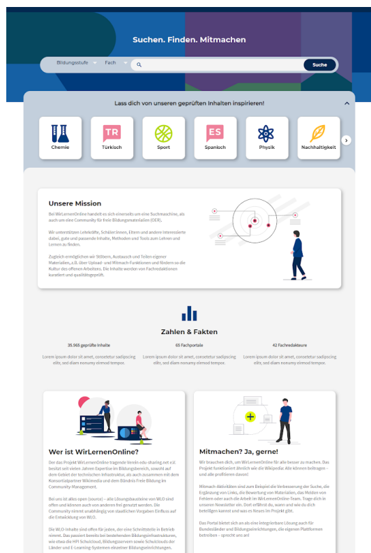
Das neue Design der WirLernenOnline-Seite

Bei "WirLernenOnline - Freie Bildung zum Mitmachen" sammeln und kuratieren erfahrene Lehrende frei im Internet verfügbare Bildungsinhalte. Bei uns entstehen Konzepte im Team - Fachredaktionen arbeiten eng mit IT-, Usability-, Design- und Rechts-Fachleuten zusammen.